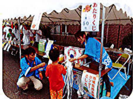
8/9 「戸ヶ崎町内会 夏まつり」 町内会で初めてとなる開催！ きしろでも、あたりくじを出店しました。