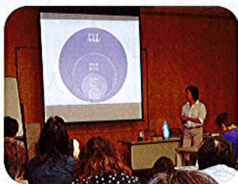
10/2「アロマでリフレッシュ」 癒しの光とアロマの香りに包まれ、 リフレッシュサロン(介護家族教室)を開催。