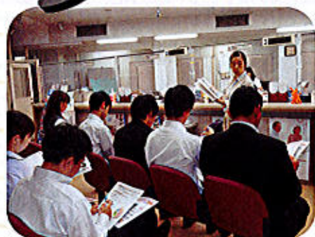
9/18「認知症サポーター養成講座」 市の保健師さんの協力の元、 市内の銀行を対象に開催しました。