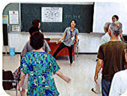
8/18 「今泉さわやかセンター 健康づくり講座”認知症ってなあに？” 脳トレと運動を組み合わせた体操、 コグニサイズがとても喜ばれました。