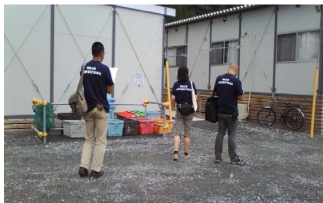
仮設住宅の訪問調査の様子

9 月になるとほぼ仮設住宅への入居が進み、主要な道路は整備され、お店やコンビニも再開され、被災者の方々が力強くこれからの生活に向けて仕事を再開しようとする姿が見られるようになっていました。津波で何も無くなった土地には、雑草や花が生えていました。活動場所は固定され、私達も何度も訪問するうち女川町への馴染みが出てきました。まだ、瓦礫撤去も手付かずの地域もあり、これからも息の長い支援が必要です。今後も心をひとつに活動を続け、一日も早く被災地が元気を取り戻してくださることを願ってやみません。