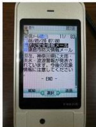
メール配信画面(イメージ)

※インターネット環境や携帯電話がない方は、事前に防災情報等について、どのように入手し避難に役立てるか、話し合っておきましょう。